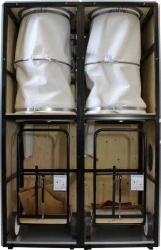
Stoftavskiljare BZ14, öppen.